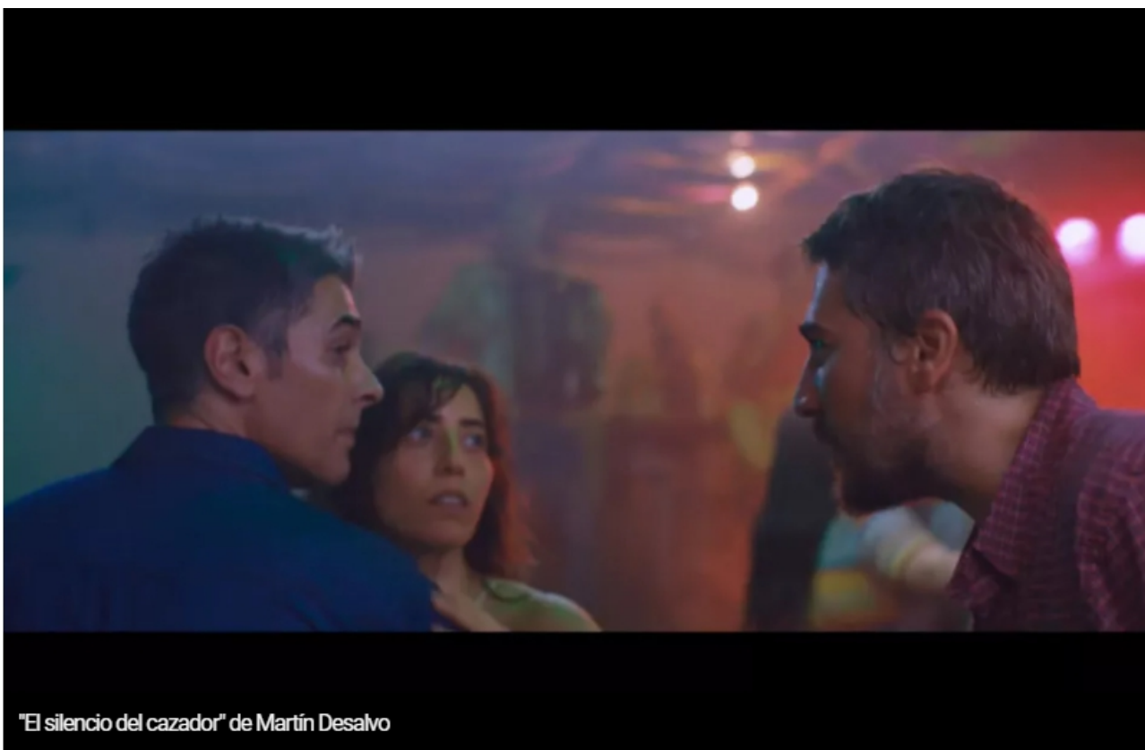
"El silencio del cazador" de Martín Desalvo

El argentino Martín Desalvo se quedó con el premio al mejor director por "El silencio del cazador" de la 36 edición del Festival de Cine Iberolatinoamericano de Trieste. "Mapa de sueños latinoamericanos", de Martín Weber, consiguió el premio a la Mejor Película y al Mejor Guion en la Competencia Contemporánea, además de llevarse el Premio del Público.